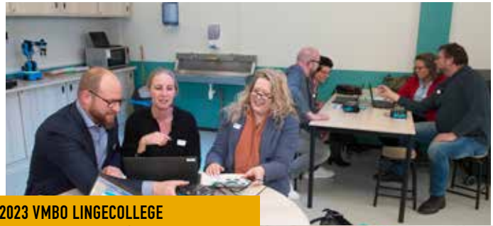
7 MAART 2023 VMBO LINGECOLLEGE "NU INVESTEREN IN DE MEDEWERKERS VAN LATER"