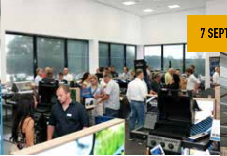
7 SEPTEMBER 2022 NAPOLEON