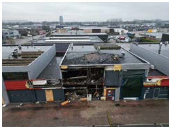
Situatie Morsestraat Tiel na brand

Ondermijnende criminaliteit brengt aanzienlijke risico's met zich mee voor u als ondernemer. Naast de directe gevaren, zoals explosies en branden, kunnen criminele activiteiten leiden tot gezondheidsrisico's, imagoschade, verlies van klanten en verhoogde veiligheidskosten. De brand aan de Morsestraat in januari 2025 illustreert dit. De vlammen